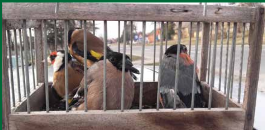
Divlje ptice koje se u Srbiji najčešće nezakonito drže u zatočeništvu i prodaju su: češljugar ( Carduelis carduelis ), čižak ( Spinus spinus ) i zimovka ( Pyrrhula pyrrhula ).